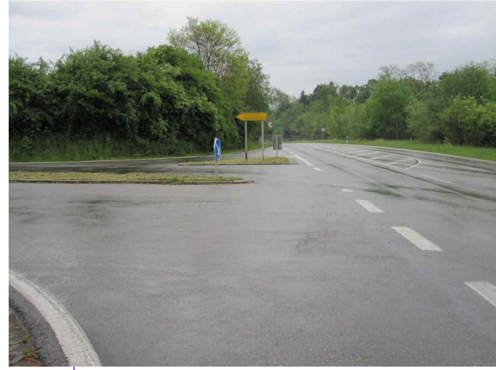
Abb. 2: Einmündung Richtung Oberreitnau