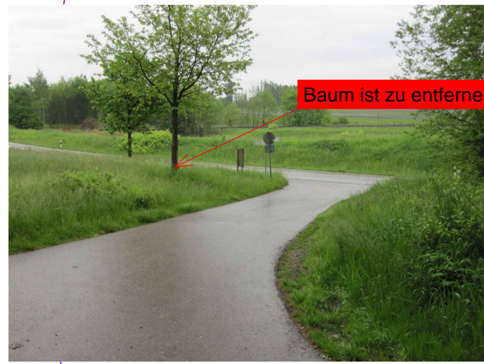
Abb. 1: Baubeginn Planungsabschnitt West