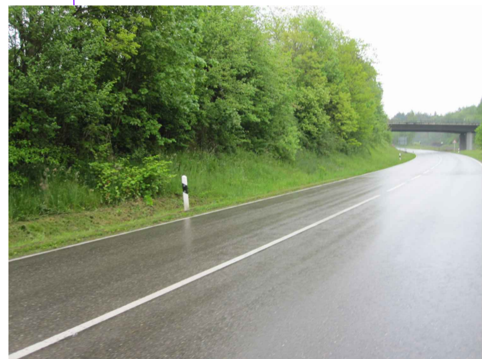
Abb. 3: Böschung nördlich der St 2374